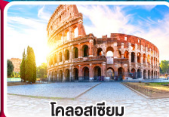
โคลอสเซียม

ลิ้มรสพาสต้า พิชซ่า และสปาเก็ตตี้ แบบต้นตำหรับอิตาลี