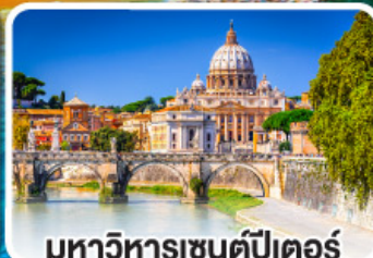
มหาวิหารเซนต์ปีเตอร์