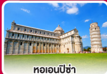
หอเอนปิซ่า