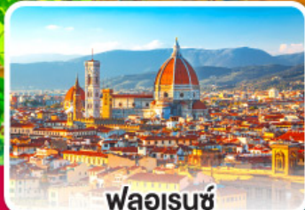
ฟลอเรนซ์