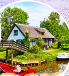
หมู่บ้านกีร์ซัน