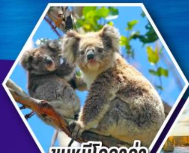
ชมหมีโคอาล่า ณ สวนสัตว์ซิดนีย์