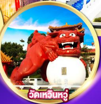
วัดเหวินหู่

โรงละครไทจง-หมู่บ้านปศาจซีโกว วัดเหวินหู่, วัดหลงซาน-ล่องเรือทะเลสาบสุริยันจันทรา พิพิธภัณฑท์แห่งชาติกู่กง-ถนนโบราณจิวเฟิ่น ช้อปปิ้งตลาดไทจง, ตลาดซีเหมินติง, Gloria Outlet