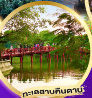
ทะเลสาบคินคาบ