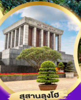
สุสานลุงโฮ