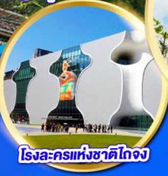
โรงละครแห่งชาติไทจง