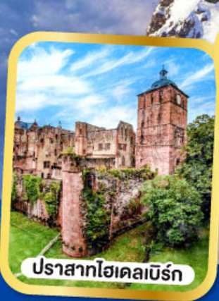
ปราสาทไฮเคลเบิร์ก