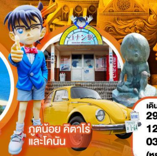
กูดน้อย คิตาโร่ และโคนัน

เดินทาง 29 ต.ค.-03 พ.ย. 67 12-17 พ.ย. 67 03-08 ธ.ค. 67 (หยุดยาววันพ้อ)