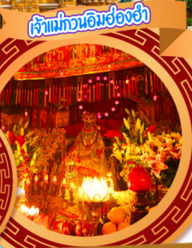
เจ้าแม่ทวนอิมฮ่องกง

05-08, 17-20 ต.ค., 31 ต.ค.-03 พ.ย.67 02-05, 07-10, 14-17, 16-19 พ.ย.67 21-24 พ.ย., 28 พ.ย.-01 ธ.ค.67