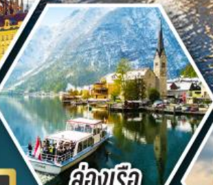
ล่องเรือ ทะเลสาบอัลสตัด