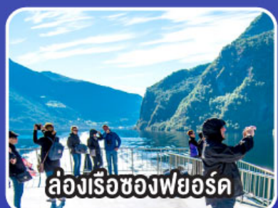
ล่องเรือช่องฟยอร์ด