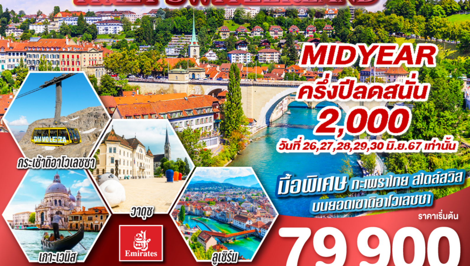
กระเซ้าดีอาโวลูเซซ่า