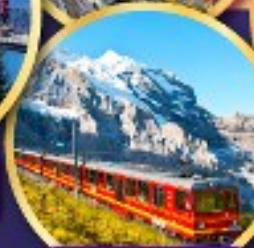
ยอดเขาจุงเฟรา