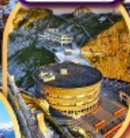
ยอดเขาฟีลาตุส