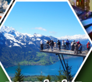
ยอดเขาฮาร์เดอร์คูลม

พักเมืองเชอร์แมก เมืองตากอากาศระดับโลก ที่มีฉากหลังเป็นยอดเขามัตเตอร์ฮอร์น ราคาเริ่มต้น