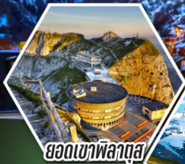
ยอดเขาพิลาตุส