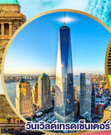
วันเวิลด์เทรดเซ็นเตอร์