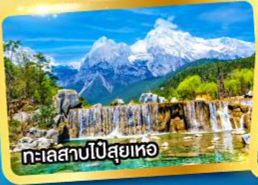
ทะเลสาบไป๋สฺยเหอ