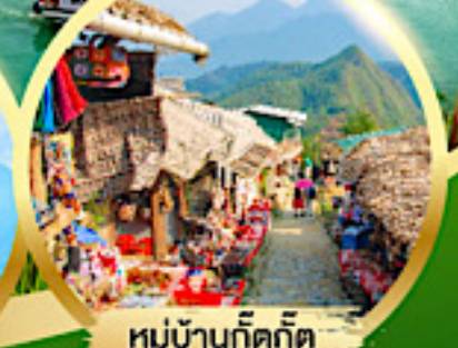
หมู่บ้านก๊ตก๊ต