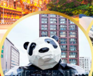
หมีแพนด้าปิ่นตึก