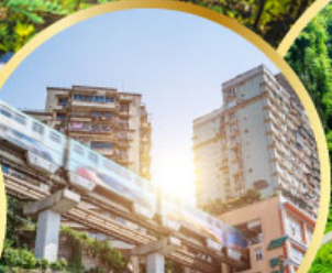
รถไฟฟ้าทะลุติ๊ก หลุมฟ้าสะพานสวรรค์