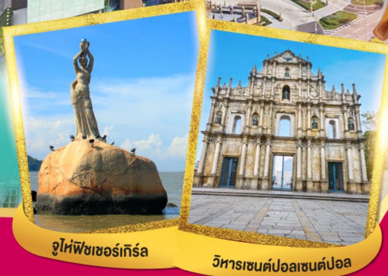
จูไห่ฟิชเชอร์เกิร์ล