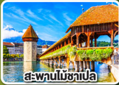
สะพานไม้ชาเปล