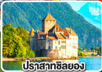
ปราสาทซิลยง