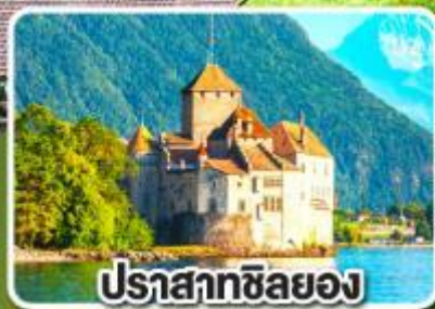
ปราสาทซิลยง