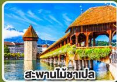
สะพานไม้ชาเปล