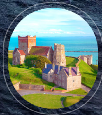
United Kingdom Dover

ราคา รวม : อาหารทุกมื้อบนเรือสำราญ, טיפพนักงานบนเรือ, ทาซีท่าเรือ | ราคาไม่รวม : ตั๋วเครื่องบิน, ค่าทำวีซ่า, ภาษีเตรียมบนฝั่ง