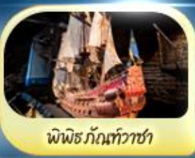
พิพิธภัณฑ์ทิวาชา