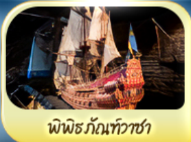
พิพิธภัณฑ์ท้าวชา