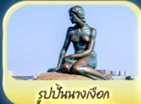
รูปปั้นนางเงือก