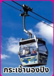
กระเช้านองปัง