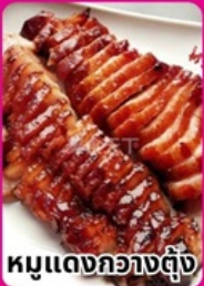
หมูแดงกวางตุ้ง