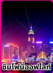
ชมไฟนีออนไฟท์