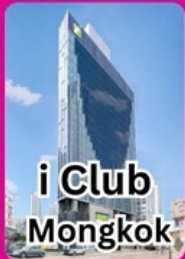
i Club Mongkok

คอนเฟิร์มเดินทาง 23-25 ตุลาคม 2567 พัก 4 ดาวย่านช้อปปิ้ง i CLUB MONGKOK