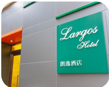
Lagos Hotel (จอร์แดน)