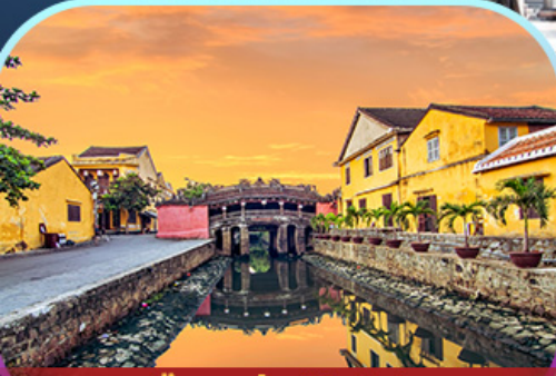
เมืองเก่า Hoi An