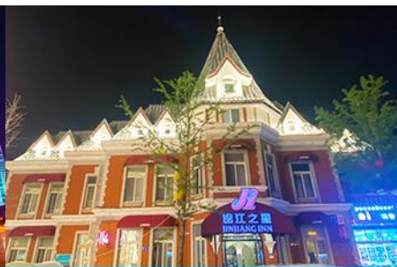
กบบริสเซีย