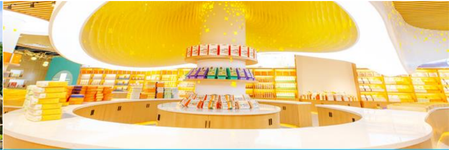
พิพิธภัณฑ์ดอกกุยฮวา