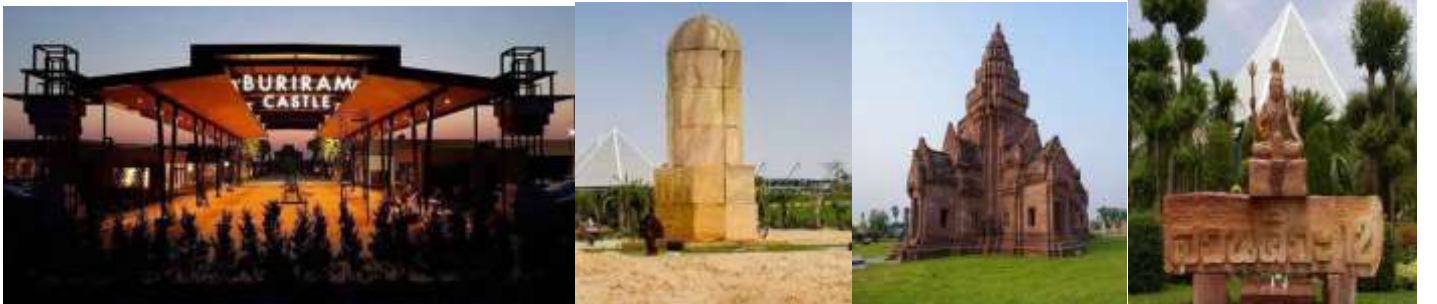
พักที่(N1) โรงแรม r2 (จ.บุรีรัมย์) หรือเทียบเท่า

18.00 น. รับประทานอาหารค่ำอิสระ ที่ BURIRAM CASTLE เป็นส่วนหนึ่งของ BURIRAM UNITED ตั้งอยู่ระหว่างสนาม Chang ARENA และสนามแข่งรถระดับโลก CHANG INTERNATIONAL CIRCUIT พื้นที่ขนาด 93,000 ตร.ม. แบ่งเป็น Avenue Area 35,000 ตร.ม. ,ปราสาทหินพนมรุ้งจำลอง 14,000 ตร.ม., สวนไม้ดอก ไม้ประดับ และสวนตะบองเพชร 35,000 ตร.ม. (ออกแบบและจัดสร้างโดย สวนนงนุช), CAR PARKING 8,000 ตร.ม. เป็นแหล่งอารยธรรมใหม่...ที่รวมหัวใจของบุรีรัมย์ไว้...ที่นี่ ที่เดียว ที่รวมความต้องการให้กับทุกคนได้ ไม่ว่าจะ เป็นชาวบุรีรัมย์ เพื่อนพี่น้องจากจังหวัดใกล้เคียง นักท่องเที่ยวทั้งไทยและต่างชาติ ที่นี่...ผसानโลก 2 ยุค ได้อย่างลงตัวที่สุด ความงดงามของอารยธรรมขอมในอดีต ผสานเป็นหนึ่งเดียวกับโลกไลฟ์สไตล์คนรุ่นใหม่ด้วย มาตรฐานที่เป็นสากล เปิดบริการ ปี 2558 (ต้นไตรมาส 3 ) มีปราสาทพนมรุ้งจำลอง เป็นจุด landmark และมีสวนหินและสวนตะบองเพชรขนาดใหญ่ ชม มหาสิวลึงค์ ที่ใหญ่ที่สุดในโลก “มหาสิวลึงค์” ตั้งอยู่ในสวน “สวนศิเว 12” โดย มหาสิวลึงค์ ทำจากหินทราย สูงกว่า 9 เมตร ซึ่งใหญ่ที่สุดในโลก รายรอบด้วยแผ่นศิลาหินทราย “กามาสูตร” ซึ่งเปรียบดั่งจุดกำเนิดแห่งจักรวาล