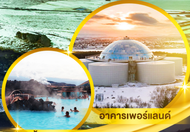
อาคารเทอร์โมแลนค์