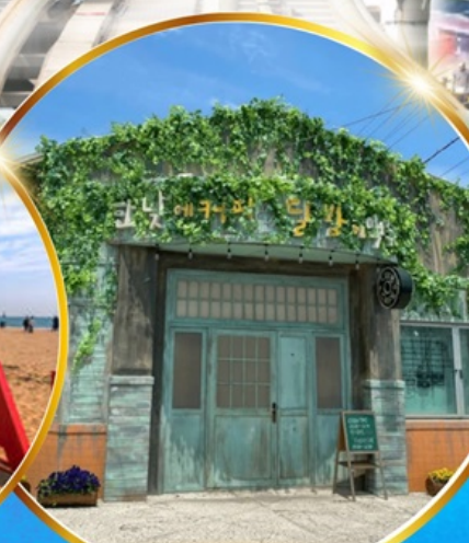
ตามรอยซีรีส์ดัง Hometown chachacha

โพลังสเปซวอล์ค สกายวอร์ค ตามรอยซีรีส์ Hometown chachacha ถ่ายรูปชิคๆ หมู่บ้านวัฒนธรรมคิมซอน ขึ้นเคเบิลคาร์ ชมทะเลปูซาน นั่งรถไฟปูคปิก sky capsule ซิมของอร่อยตลาดแฮนแด อิสระช้อปปิ้ง Lotte Duty Free