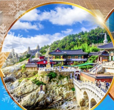
วัดแสงยงกุงซา