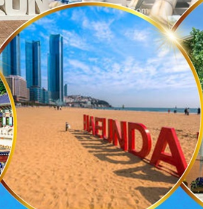
หาดแฮนแด