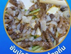
ชั้นนักชี อาหารท้องถิ่น