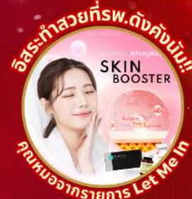
อิสระทำสวยที่พ.ดังคังนัม!! SKIN BOOSTER คุณนงนารถรายการ Let Me In

ชมจอ LED ขนาดยักษ์ที่รีสอร์ท 5 ดาว ใหญ่ที่สุดในเอเชียเหนือ ชมพระราชวังคยองบกคุง ย่านอนดัตหมู่บ้านบุคซอน ฮันอก ใส่ชุดฮันบก ทำข้าวห่อสาหร่าย อิสระช้อปปิ้ง Lotte Duty Free