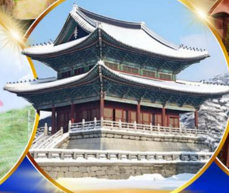
พระราชวังเคียงบกคุง