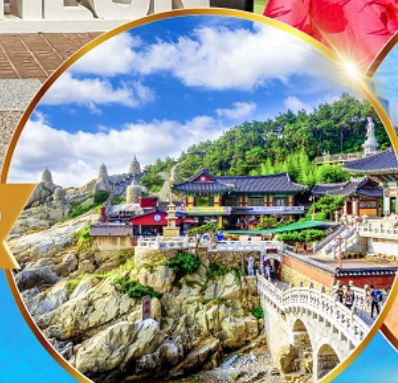
วัดแสงยงกุงซา