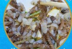
ชั้นนักกีฬา อาหารท้องถิ่น