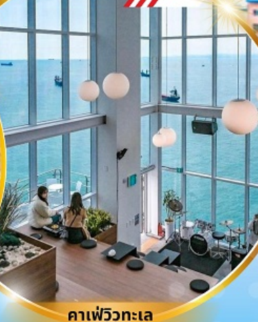
คาเฟ่วิวทะเล

ถ่ายรูปชิคๆ หมู่บ้านวัฒนธรรมคิมซอน ใหม่ล่าสุด คาเฟ่ริมทะเล วิวหลักล้าน ขึ้นเคเบิลคาร์ ชมทะเลปูซาน ห้ามพลาด!! ตลาดปลาที่ใหญ่ที่สุด ชิมของอร่อยที่ตลาดแฮนแด ช้อปปิ้งตลาดพื้นเมือง แหล่งช้อปปิ้งใต้ดิน ซัมซอน อิสระช้อปปิ้ง Lotte Duty Free