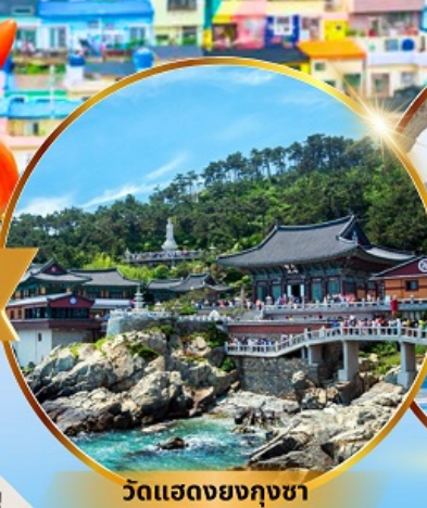
วัดแฮดงยงกุงซา