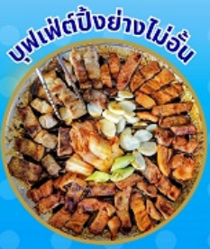
บุฟเฟ่ต์ปิ้งย่างไม่อื่น