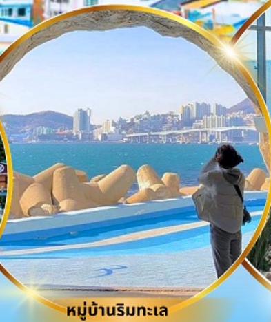
หมู่บ้านริมทะเล