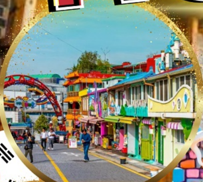
หมู่บ้านเทพนิยาย