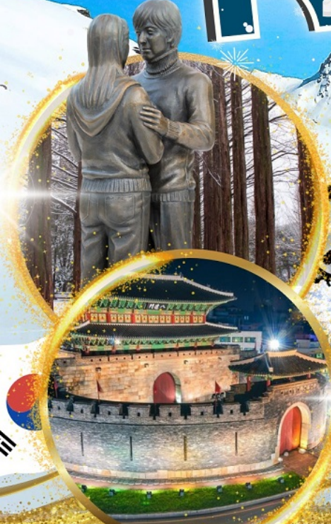
ป้อมฮวาซอง