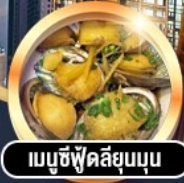
เมมูซี่ฟู้ดลี่ยูนบุน