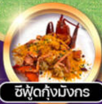
ซิวัดกั๊งม้งกร