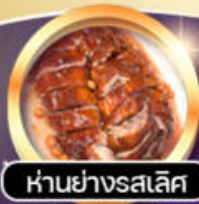
ห่านย่างรสเลิศ