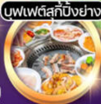
บพพตัสกัป้งย่าง