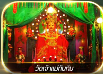
วัดเจ้าแม่กัณทิม