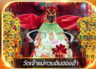
วัดเจ้าแม่กวนอิมสองห้า