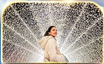
ชมงานประดับไฟนารานา โนะ ซาโตะ