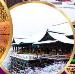
วัด คิโยมิสึ