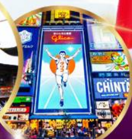
ช้อปปิ้ง ซินโซบาชิ

ราคา เดียว 49,919 บาท รวมภาษีมูลค่าเพิ่ม 7%