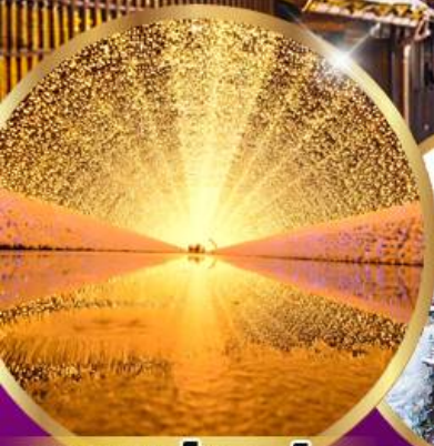
นาบาระ โนะ ซาโตะ