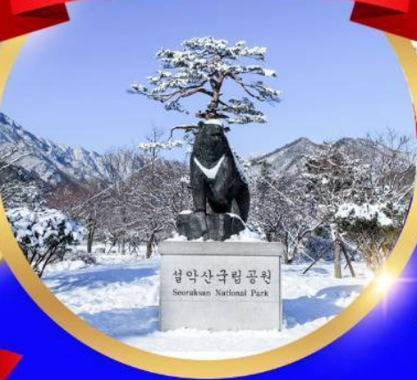
อุทยานแห่งชาติชอรัคซาน