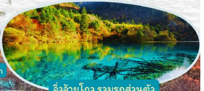
จิวจ้ายโกว รวมรถส่วนตัว