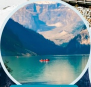
ทะเลสาบเต๋ยซี