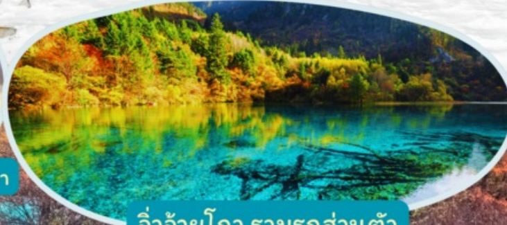
จิวจ้ายโกว รวมรถส่วนตัว