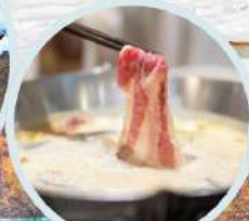
เมนูพิเศษ สุกี้หม่าล่า