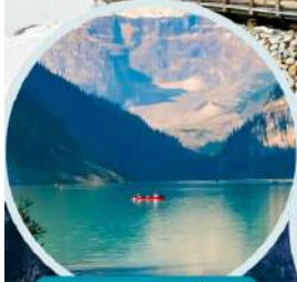
ทะเลสาบเตี๋ยซี