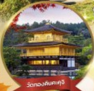
วัดทองคินคะคุจิ