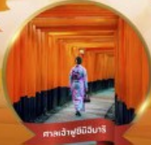
ศาลเจ้าฟูชิมิอิซามิ