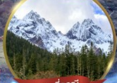
ภูเขาสัตว์หายาก