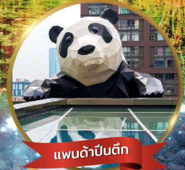
แพนด้ายักษ์จีนตึก

มหัศจรรย์ความงาม อุทยานจิวจ้ายโกว (รวมรถเหมาเที่ยวอุทยานเต็มวัน) ชมอุทยานหวงหลง (รวมกระเช้า) • สีดรุณี • อุทยานชวงเจียวโกว (รวมรถอุทยาน) เมืองเก่าซงพาน • ถนนคนเดินจินหลี่ + ไท่กุ่หลี่ • ชมแพนด้ายักษ์จีนตึก