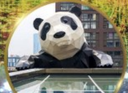
แพนด้ายักษ์ปิ่นตึก

มหัศจรรย์ความงาม อุทยานจิวจ้ายโกว (รวมรถเหมาเที่ยวอุทยานเต็มวัน) ชมอุทยานหวงหลง (รวมกระเช้า) • สัตว์หายาก • อุทยานเขี้ยวโกว (รวมรถอุทยาน) เมืองเก่าชงฟาน • ถนนคนเดินจิมหลี่ + ไถ่ตู้หลี่ • ชมแพนด้ายักษ์ปิ่นตึก