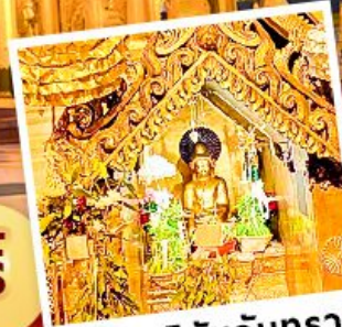
พระสุริยันจันทรา