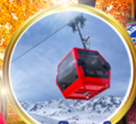
กระเช้ากุลมาร์ค ชมวิวยอดอลังการ