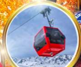
กระเช้ากุลมาร์ค ชมวิวสุดอลังการ