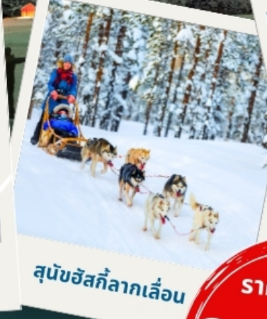
สุนัขฮัสกีลากเลื่อน