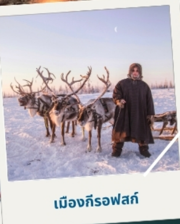
เมืองก็รอฟสค์