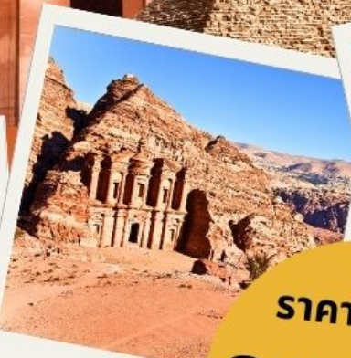
เพตรา นครศิลาสีชมพู